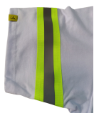
Destaque de cores no interior das mangas