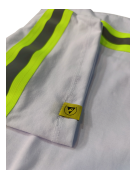
Faixa refletiva no interior da manga