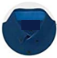
Destaque de cores na gola e com fecho em botão