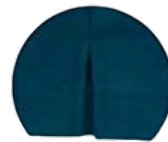
Abertura nas laterais para facilitar o vestir