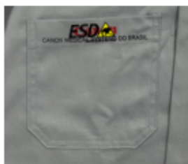
Bordado Sik no bolso