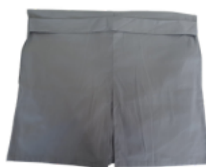
Com faixa e abertura nas costas e laterais